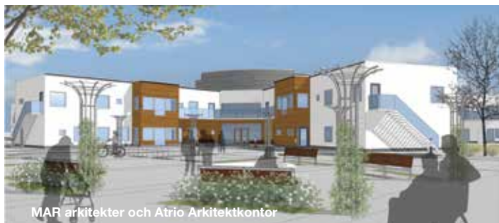
MAR arkitekter och Åtrio Arkitektkontor