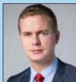
Gustav Fridolin Utbildningsminister Utbildnings- departementet