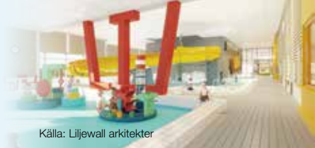
Källa: Liljewall arkitekter