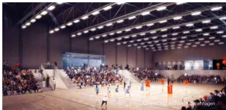
Källa: NORD Architects Copenhagen