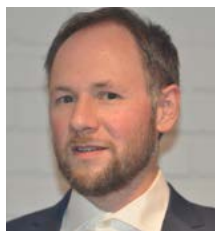
Per Tuvall Trafikverket