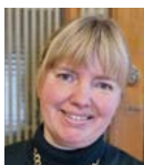
Li Langemark SKR Kompetenscenter välfärdsteknik