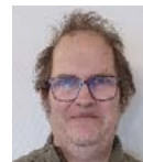
Pelle Göteborg stad